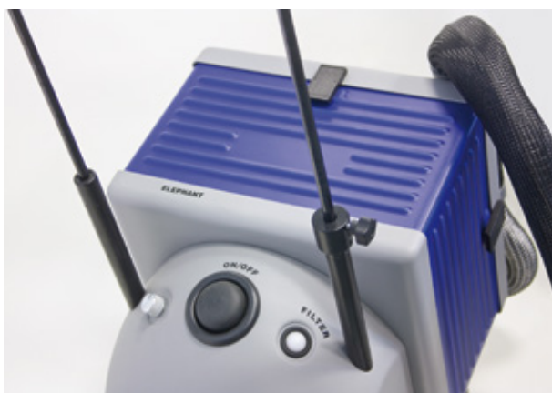
Absaug-, Filter- & Versorgungseinheit Suction, filter & supply unit