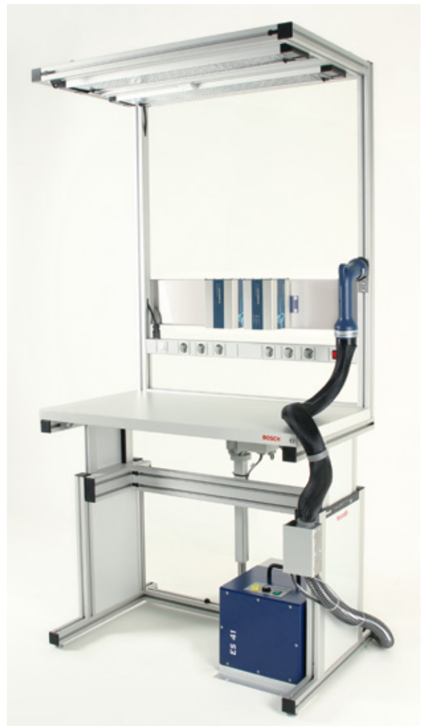
Arbeitsplatzbeispiel Example workplace

Hinweis: Technische Informationen s. Zubehör/Datenblatt Advice: Technical information s. Accessory/Datasheet