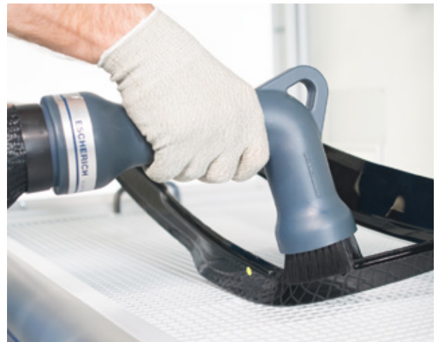
Anwendungsbeispiel ELEPHANT 110 Example application ELEPHANT 110